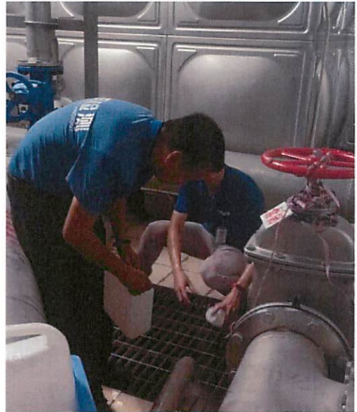
图 2：越秀星汇名庭采样口