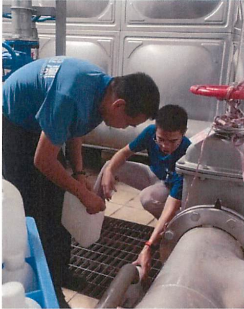
图 1：越秀星汇名庭采样口