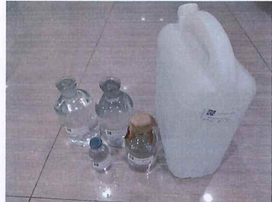
鹤山北控水务第三水厂出厂水样品