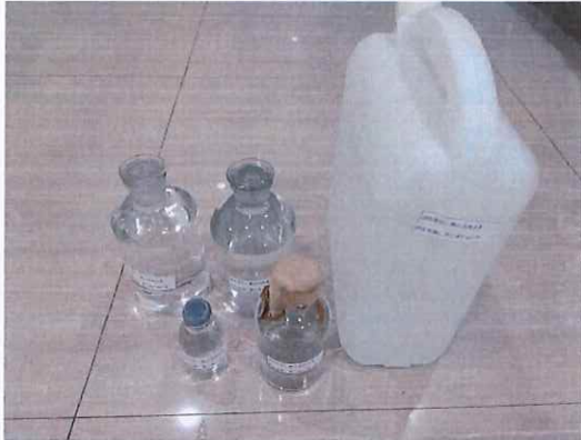
鹤山北控水务第三水厂出厂水样品